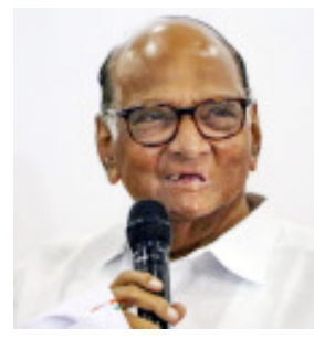
काँग्रेसला एक, राष्ट्रवादी काँग्रेसला ४ आणि एमआयएमला १ अशा ६ जागा विरोधकांना मिळाल्या होत्या. परंतु, या निवडणुकीत आम्हा लोकांची संख्या ३० ते ३५ वर जाईल. लोकांना बदल हवा आहे. लोकांकडून काँग्रेस, राष्ट्रवादी आणि उद्धव ठाकरे

सातारा दि.९ (प्रतिनिधी)- राष्ट्रवादी काँग्रेसमध्ये विलीन होणार नाही, असे स्पष्टीकरण गुरुवारी शरद पवार यांनी दिले. पुढील दोन वर्षांत अनेक प्रादेशिक पक्ष काँग्रेससोबत समन्वयाने काम करतील किंवा काँग्रेस पक्षात विलीन होतील, असे भाकीत शरद पवार यांनी एका मुलाखतीत व्यक्त केले होते. त्यावरून राष्ट्रवादी काँग्रेस पक्ष काँग्रेसमध्ये विलीन होणार, अशी चर्चा रंगली होती. त्यावर शरद पवार यांनी हे स्पष्टीकरण दिले. ते गुरुवारी साताऱ्यात पत्रकारांशी बोलत होते. २०१९ च्या निवडणुकीत