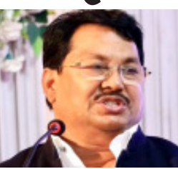
पश्चात्ताप होणार आहे. मी आधीच गंमतीने म्हणालो होतो की एकनाथ शिंदे आणि अजित पवार हे पहिले अग्निवीर ठरतील, अशी खोचक टीकाही त्यांनी केली. त्यांनी पुढे सांगितले की, भाजपची जी नीती आहे ते लोकांचे घर उद्ध्वस्त करून स्वतःचे घर बसवतात, ते

केली. याबाबत बोलताना विजय वडेटीवार म्हणाले की, चंद्रकांत पाटील जे काही बोलले त्यावरून वैयक्तिक राग असल्याचे दिसून येते. त्यामुळे त्यांच्यासोबत असणं हे देखील दुर्दैव असल्याचे ते म्हणाले. वडेटीवार म्हणाले की, पीएम मोदी द्रोघपती निवडणुकीसारखे आहेत. हे पहिले पंतप्रधान आहेत, ज्यांना प्रत्येक लोकसभेत जाण्याची वेळ आली आहे यातच त्यांचे अधःपतन दिसते. अजित पवार कुठे आणि कुठल्या विचाराने जाऊन बसले याचा त्यांना