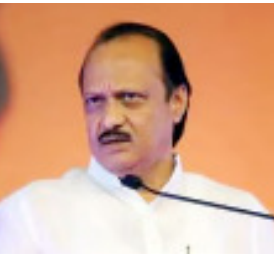
असल्याचं देखील अजित पवार म्हणाले आहेत. शरद पवार आमचं दैवत आहे. त्याबद्दल दुमत नाही. पण प्रत्येकाचा काळ असतो कुठेतरी ८० वर्षांच्या पुढे गेल्यानंतर नवीन त्यांना संधी द्यायला पाहिजे. मी त्यांचा मुलगा असतो तर मला संधी मिळाली असती, (पान ४ वर)