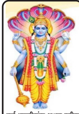
सर्व भारतीयाना अक्षय तृतीया निमित्त हार्दिक शुभेच्छा !

(वर्ष ६३ वे अंक १२५) पोस्टाचा परवाना नं. / अ / आर / ए.जी.डी. - ०७ / २०२३ छत्रपती संभाजीनगर (औरंगाबाद), शुक्रवार, दि. १० मे २०२४ (पाने ४) (किंमत २ रुपये)