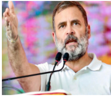
तेलंगणातील एका सभेला संबोधित करताना पंतप्रधान मोदी यांनी अदानी-अंबानी या विषयावरून काँग्रेसवर टीका केली होती. याला प्रत्युत्तर देताना राहुल गांधींनी बुधवारी भाजपसह मोदींवर जोरदार प्रहार केला. ते म्हणाले की, मोदीजी थोडे धाबरला आहात काय? तुम्ही बंद खोलीत अदानी-अंबानी

हा एक मोठा मुद्दा आहे. ते खोटे बोलत आहेत. भरती भरोसा स्कीमच्या माध्यमातून तरुणांच्या हाताला काम मिळणार आहे. राहुल गांधींनी सोशल मीडिया प्लॅटफॉर्म एक्सवर व्हिडीओ शेअर करत मोदींवर टीकासत्र सोडले. त्यांनी कॅप्शनच्या माध्यमातून म्हटले की, ४ जून रोजी इंडिया आघाडीचे सरकार बनत आहे आणि १५ ऑगस्टपर्यंत आम्ही देशातील ३० लाख रिक्त सरकारी पदांच्या भरती प्रक्रियेचे काम सुरू करणार आहोत ही आमची गॅरंटी आहे. नरेंद्र मोदींच्या खोट्या प्रचाराला बळी पडू नका, तुम्ही तुमच्या मुद्द्यांवर टाम राहा असे ते म्हणाले.