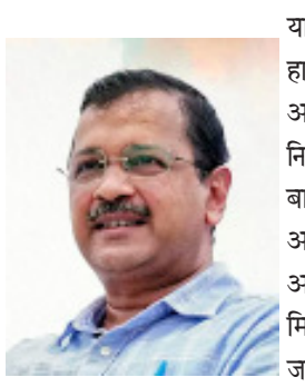
कोणत्याही व्यक्तीला अंतरिम जामीन मिळालेला नाही, असे ईडीने सर्वोच्च न्यायालयाच्या निदर्शनास आणून दिलं आहे. पुढे या प्रतिज्ञा पत्रात ईडीने असाही म्हटला आहे, की जर अरविंद केजरीवाल यांना जामीन मिळाला, तर कोणत्याही नेत्याला अटक करणे किंवा कोर्टात ठेवणे कोर्टाण होईल, कारण देशात निवडणुका होत राहतात, गेल्या ५ वर्षांत देशात १२३ वेळा निवडणुका झाल्या आहेत.

नवी दिल्ली दि.९ (वृत्तसंस्था)- दिल्लीतील कथित मद्य धोरण घोटाळ्याप्रकरणी दिल्लीचे मुख्यमंत्री अरविंद केजरीवाल यांना ईडीकडून अटक करण्यात आली आहे. ते सध्या तिहार तुरुंगात आहेत. मात्र, लोकसभा निवडणुकीदरम्यान प्रचार करण्याची परवानगी मिळाली, अशी मागणी करणारी याचिका त्यांनी सर्वोच्च न्यायालयात दाखल केली आहे. उद्या म्हणजे शुक्रवारी १० मे रोजी सर्वोच्च न्यायालय या याचिकेवर निकाल देण्याची शक्यता आहे. मात्र, यापूर्वी ईडीने अरविंद केजरीवाल यांच्या याचिकेला विरोध केला आहे. निवडणूक प्रचार करणे हा मूलभूत अधिकार नसल्याचा युक्तिवाद ईडीकडून करण्यात आला आहे. एनडीटीव्हीने दिलेल्या वृत्तानुसार, अरविंद केजरीवाल यांच्या याचिकेला विरोध करत ईडीने सर्वोच्च न्यायालयात प्रतिज्ञापत्र दाखल केले आहे.