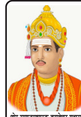
श्री समाजसुधारक बसवेश्वर महाराज जयंती निमित्त हार्दिक शुभेच्छा !