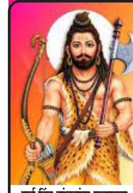
सर्व हिंदू बांधवांना परशुराम जयंती निमित्त हार्दिक शुभेच्छा !