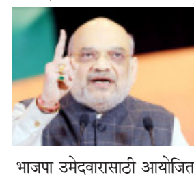
भाजपा उमेदवारासाठी आयोजित प्रचारसभेत बोलताना शाह यांनी दावा केला आहे की, भाजपा सत्तेत आल्यास आम्ही मुस्लिम आरक्षण रद्द करू आणि अनुसूचित जाती, अनुसूचित जमाती आणि इतर मागासवर्गीयांचं (ओबीसी) आरक्षण वाढवू. अमित शाह म्हणाले, काँग्रेस खोटं बोलून, अफवा पसरवून निवडणुका लढू आणि जिंकू पाहत

नवी दिल्ली दि.९ (वृत्तसंस्था)- लोकसभा निवडणुकीच्या प्रचारात मुस्लिम आरक्षण हा कळीचा मुद्दा बनला आहे. मुस्लिम आरक्षणवरून पंतप्रधान नरेंद्र मोदी हे सातत्याने काँग्रेससह इंडी आघाडीवर टीका करत असतानाच विहारचे माजी मुख्यमंत्री आणि राष्ट्रीय जनता दलाचे प्रमुख लालू प्रसाद यादव यांनी सत्तेत आम्ही आल्यास मुस्लिम समाजाला आरक्षण देऊ असं बक्तव्य केलं आहे. अशातच आता केंद्रीय गृहमंत्री अमित शाह यांनीदेखील मुस्लिम आरक्षणबाबत मोठं बक्तव्य केलं आहे. तेलंगणाच्या भोन्नगिर लोकसभा मतदारसंघात