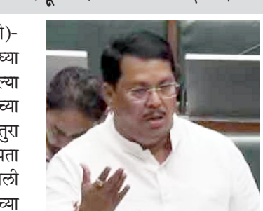
केलेल्या भाषणातून त्यांनी सत्ताधाऱ्यांना टोले लगावल्याचं दिसून आलं. विजय वडेटीवार यांनी भाषणातून लोकसभा निवडणूक निकालांचा उल्लेख केला. तसेच, सरकारकडून जाहीर करण्यात आलेल्या घोषणा म्हणजे ऋण काढून सण साजरा करण्यासारखा प्रकार असल्याची टीका त्यांनी केली.

मुंबई दि.१२ (प्रतिनिधी)- विधानसभा निवडणुका अवघ्या तीन महिन्यांवर येऊन टेपलेल्या असताना राज्य विधिमंडळाच्या अधिवेशनात राजकीय कलगीतुरा पाहायला मिळण्याची शक्यता राजकीय जाणकारांनी वर्तवली होती. अपेक्षेप्रमाणे यंदाच्या अधिवेशनात सत्ताधारी व विरोधी पक्षांच्या आमदारांमध्ये आरोप-प्रत्यारोपांचं राजकारण झाल्याचं पाहायला मिळालं. त्यात अजित पवारांनी मांडलेल्या अर्थसंकल्पानंतर विधानपरिषद निवडणुकीच्या निमित्तानेही राजकीय वातावरण तापल्याचं दिसून आलं. अधिवेशनाच्या शेवटच्या दिवशी अंतिम आठवडा प्रस्तावावर बोलताना विधानसभा विरोधी पक्षनेते विजय वडेटीवार यांनी