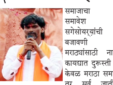
समाजाचा समावेश सगळ्यांच्याची बजावणी मराठ्यांसाठी नाही. त्या कायद्यात दुरुस्ती केली तर सर्व जातीधर्मासाठी अंमलबजावणी होणार आहे.

जालना दि.१२ (प्रतिनिधी)- सरकारने दिलेले आताचं १० टक्के आरक्षण चांगलं आहे. मागासवर्ग आयोगाने मराठा समाजाला सामाजिक आणि शैक्षणिकदृष्ट्या १० टक्के मागास सिद्ध केले आहे. परंतु, मिळालेलं आरक्षण ५० टक्क्यांच्या आत नसल्याने ते टिकत नाही. म्हणून त्याला विरोध आहे. दिलेल्या आरक्षणाची अंमलबजावणी होण्यापूर्वीच कोर्टात याचिका दाखल केली आहे. त्यामुळे आम्ही ओबीसीतून मराठ्यांना आरक्षण मागत आहोत. शासनाला एक महिन्याची मुदत दिली असून,