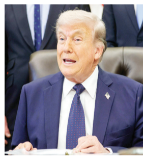
सकारात्मक झाली आहे आणि दोन्ही देशांना असा करार करायचा आहे, ज्यामुळे भारत आणि अमेरिका या दोघांनाही फायदा होईल. याचा अर्थ असा की, व्यापारी करार पुढे नेण्यासाठी दोन्ही बाजू अजूनही

वॉशिंग्टन दि.६ (वृत्तसंस्था)- भारतासोबतच्या व्यापारसंदर्भात, अमेरिकेचे अध्यक्ष डोनाल्ड ट्रम्प यांनी म्हटले आहे की, भारताने अनेक दशके अमेरिकेचा फायदा घेतला. ट्रम्प यांनी दावा केला की, आता परिसिथी बदलली आहे आणि अमेरिका भारताकडून मोठा नफा कमावत आहे. ट्रम्प पुढे म्हणाले की, अमेरिकेचा व्यापारी करारावर एकमत करण्याचा प्रयत्न करत आहेत. भारताच्या वाणिज्य मंत्रालयाने म्हटले आहे की, चर्चा