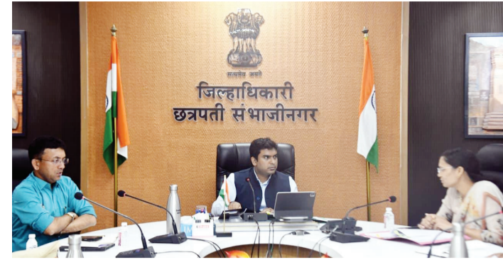
जिल्हाधिकारी छत्रपती संभाजीनगर

संबंधित विभागाने वृक्ष लागवडीसाठी योग्य जागांचे तातडीने नियोजन करावे, जेणेकरून पावसाळ्याच्या काळात लागवडीचे काम गतीने पूर्ण होईल. यावर्षी पावसाचे पाणी कमी असणार आहे. याचा नियोजनात विचार करून अधिकचे उद्दिष्ट पुढील काही वर्षांत नियोजित करावे. जेणेकरून वृक्ष जतन करण्यासाठी उपयोग होईल.